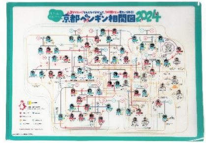
京都ペンギン相関図 2025 クリアファイル (イメージ) ※ 画像は 2024 年版

※ 販売開始日は決定し次第、当館公式 SNS（X・Instagram）でお知らせします。