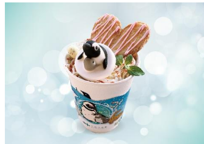
ぷかぷか☆ペンギン親子のチャイティー