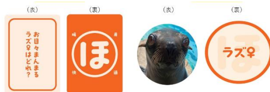
「オットセイかるた」（左：読み札、右：取り札）

こたつ型観覧席には飼育スタッフがそれぞれの個体の特徴を紹介した解説ブックとオットセイかるたを設置します。個体を識別するかるたは難問です。イベント期間中、観覧席にオットセイ担当の飼育スタッフが訪れ、勝負する機会があるかもしれません。