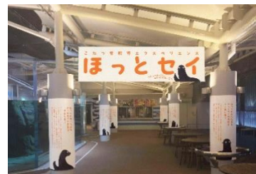
「ほっとセイ」エリアイメージ

オットセイ担当の飼育スタッフが日頃のコミュニケーションやトレーニングを行う中で感じた“ほっとする”エピソードをエリア内の柱の装飾パネルで紹介します。さらに、個体ごとの見てほしいポイントや愛らしい一面、飼育する過程で遭遇したアクシデントなど約50個のトピックスを大型パネルで紹介します。