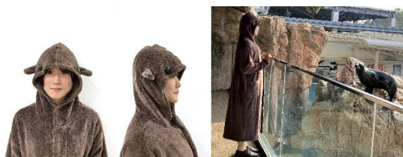
「着るほっとセイ」（イメージ）

「オットセイ」エリアの入り口には、子ども用と大人用のオットセイを模したガウンを設置します。アシカ科の中では比較的耳たぶが長いことがオットセイの特徴です。長めの耳たぶと大きな目が付いた愛らしい雰囲気のある暖かなガウンを着て、オットセイ気分でお楽しみください。